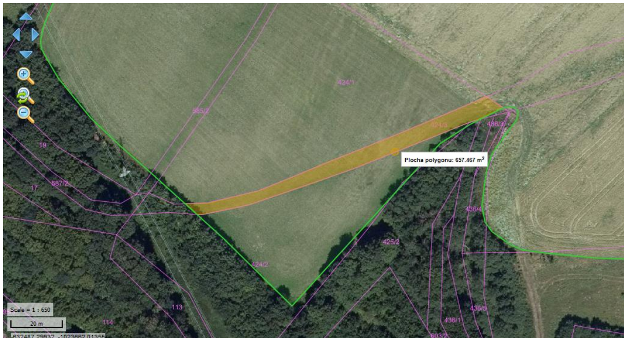
Situační mapa 1: p. č. 424/3, KÚ Heřmanice nad Labem

Heřmanice 13, 552 12 Heřmanice, IČ 002 72 647 tel.: 491 813 270, e-mail: obec.hermanice@quick.cz