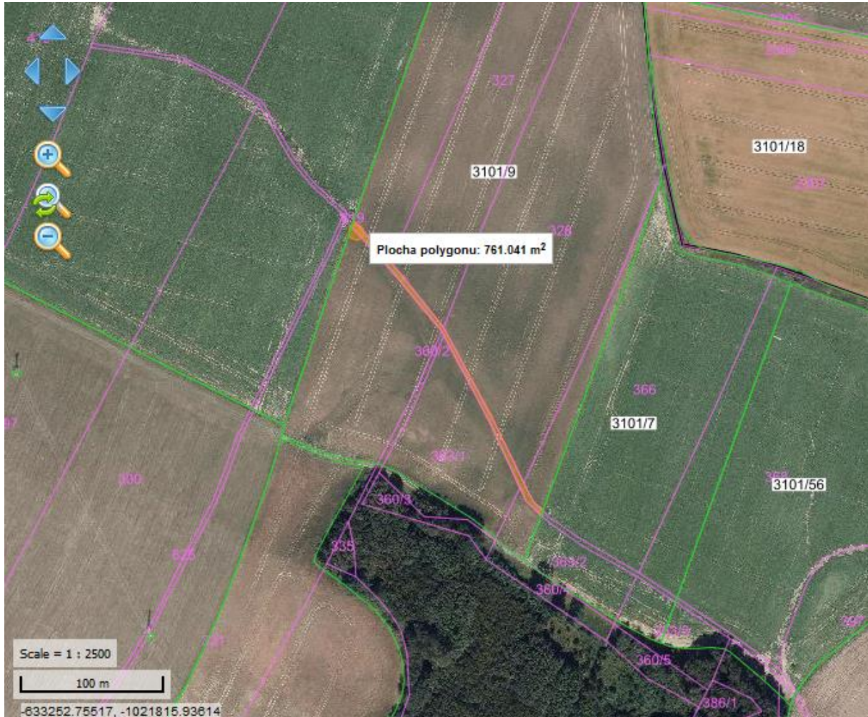
Situační mapa 1: p. č. 619, KÚ Brod nad Labem

Heřmanice 13, 552 12 Heřmanice, IČ 002 72 647 tel.: 491 813 270, e-mail: obec.hermanice@quick.cz