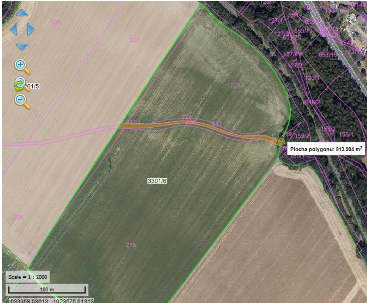
Situační mapa 3: p. č. 637/1, KÚ Brod nad Labem

Heřmanice 13, 552 12 Heřmanice, IČ 002 72 647 tel.: 491 813 270, e-mail: obec.hermanice@quick.cz